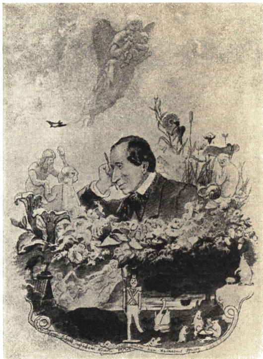
Tegning af J. A. Malmström: H. C. Andersen omgivet af Figurer fra hans Eventyr.