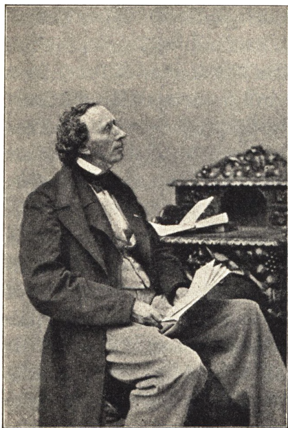
H. C. Andersen

Deres Mand lægger disse Portrætkort med ind i Pakken. Vi have endnu ikke reist noget om, som Bestemmelsen var; det har været for stormende og regnfuldt, men nu synes det snart at maatte faae Ende og derfor følger Familien mig paa Løverdag til Setubal hvor jeg bliver, i den smukke