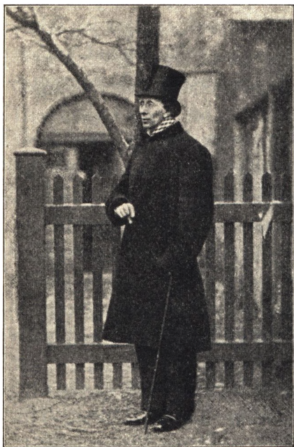
H. C. Andersen fotograferet af Theodor Collin.