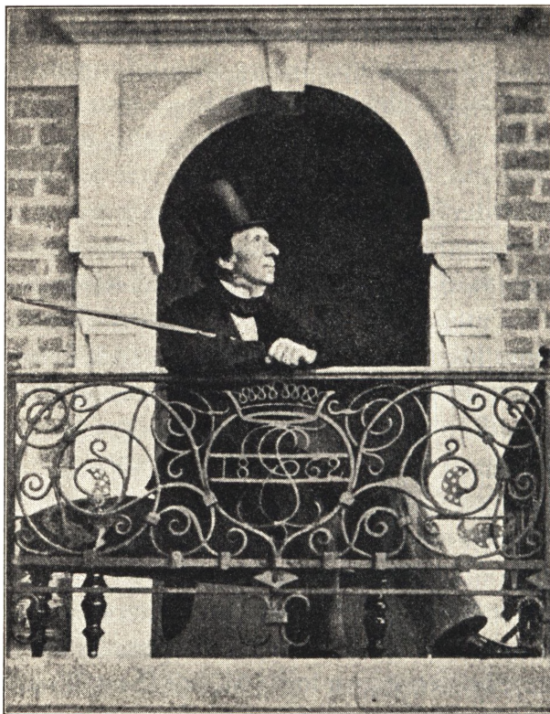
H. C. Andersen fotograferet paa Frijsenborg.