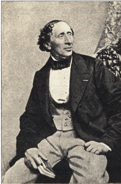
H. C. Andersen

naer Korsør, saalænge er han min Gjest uagtet jeg ikke kan gjøre Honneur som Vert. Alt dette er ikke meget fornøieligt. — Dog ogsaa nogen Glæde har jeg. Fra vore Landsmænd i London har jeg faaet Indbydelse at komme til den Fest, de gjøre i Anledning af Prindsesse Alexandras For-