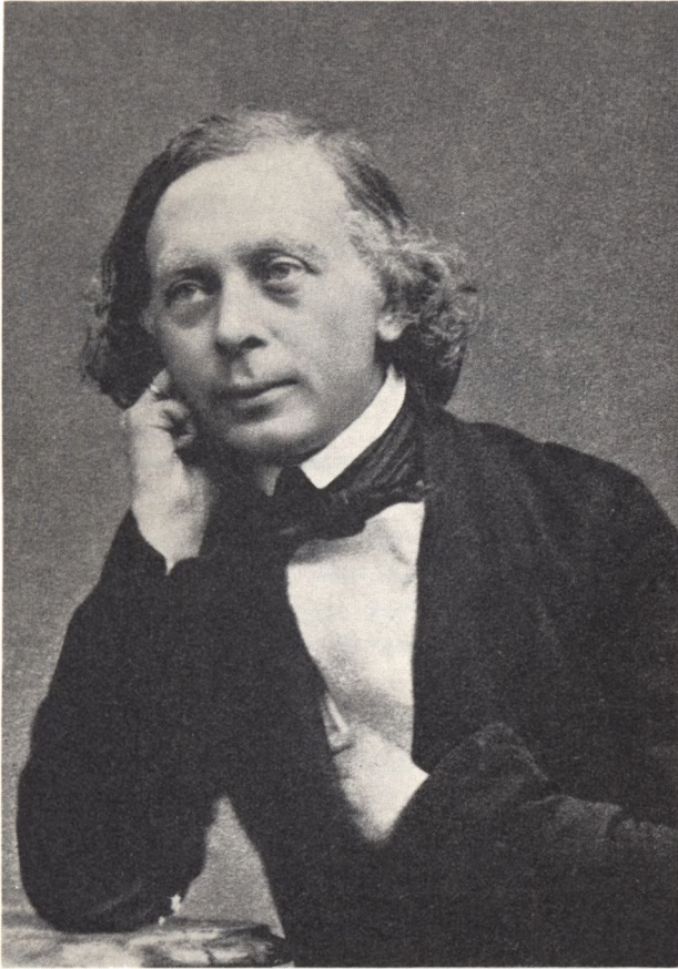
Frederik Helweg i 1850'erne