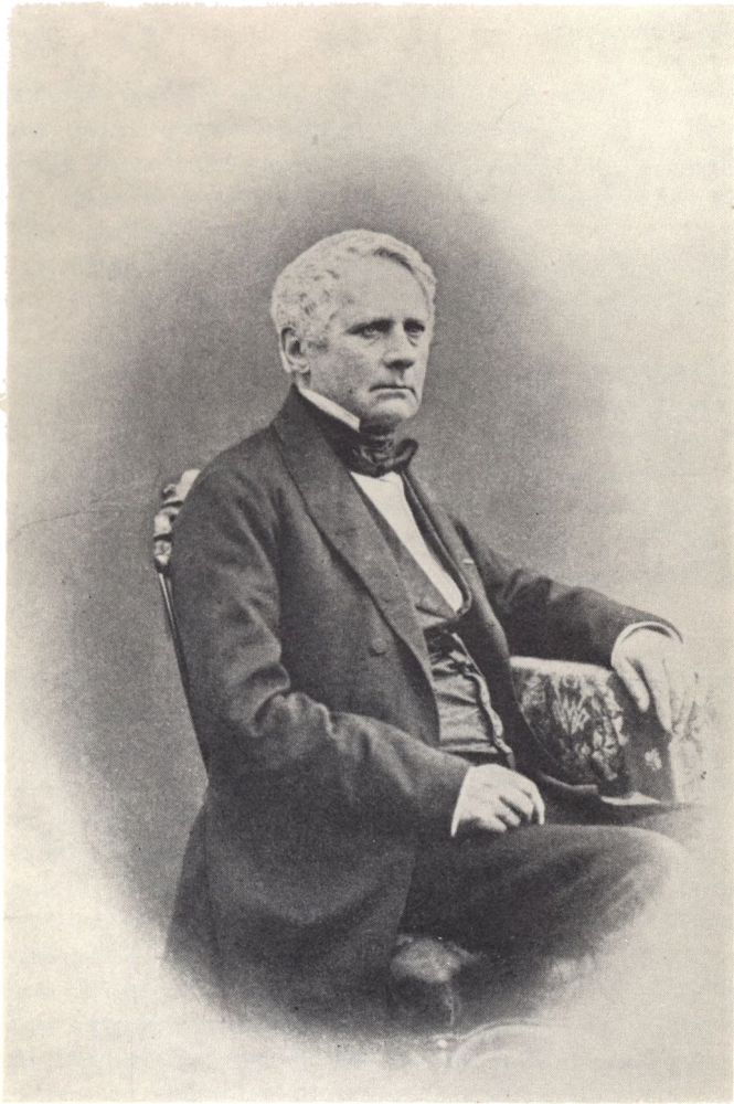
Chr. Flor Fotografi fra 1861