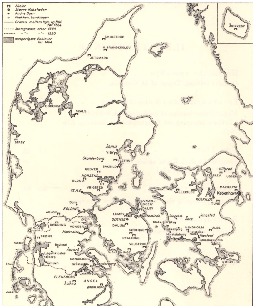
Højskoler for 1870, omtalt i brevene