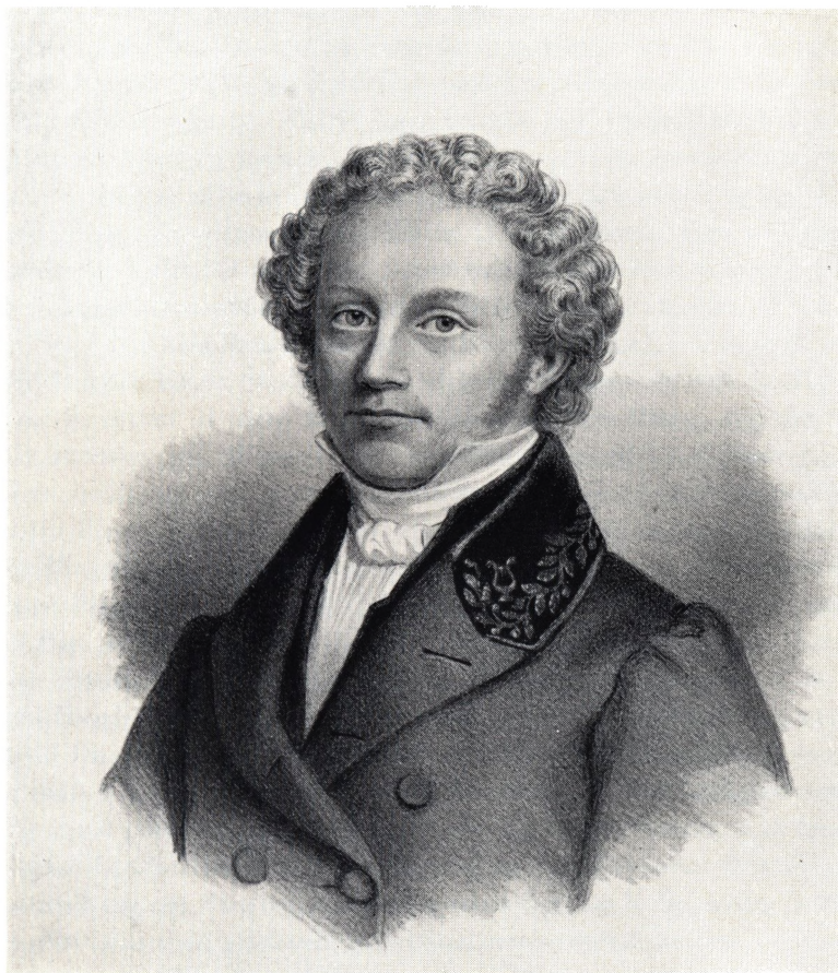
Digteren P. D. A. ATTERBOM 1790—1855