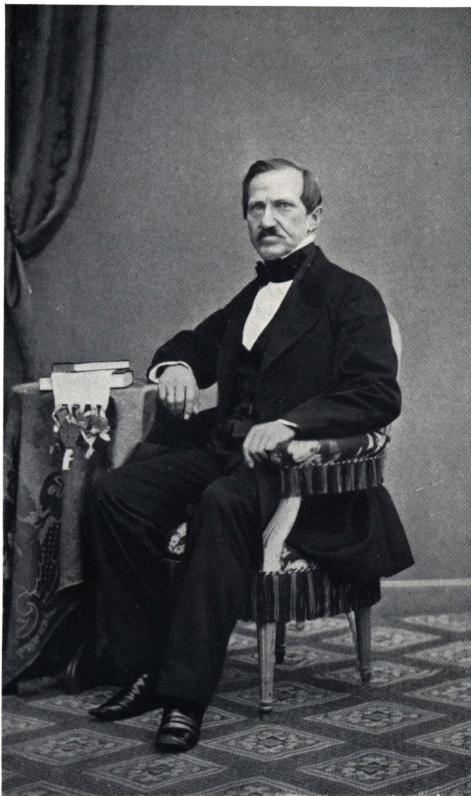
Rigsantikvar BROR EMIL HILDEBRAND 1806—1884