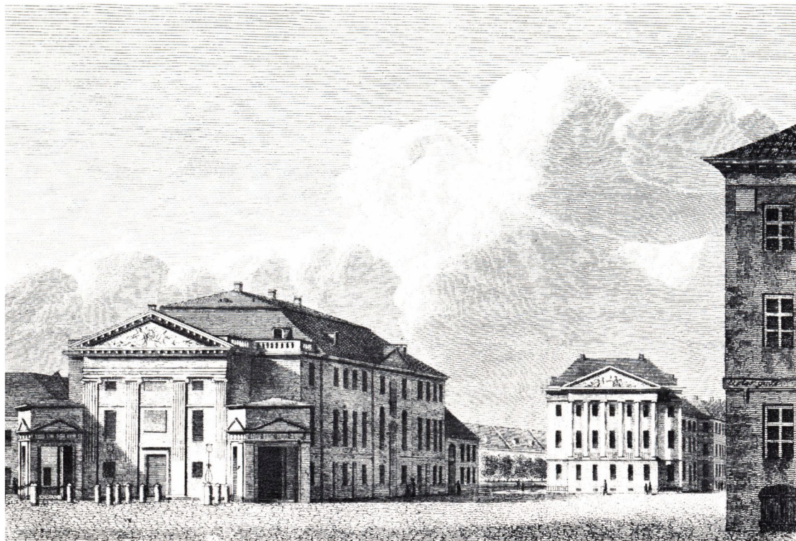
Skuespil-Huset i Kiøbenhavn